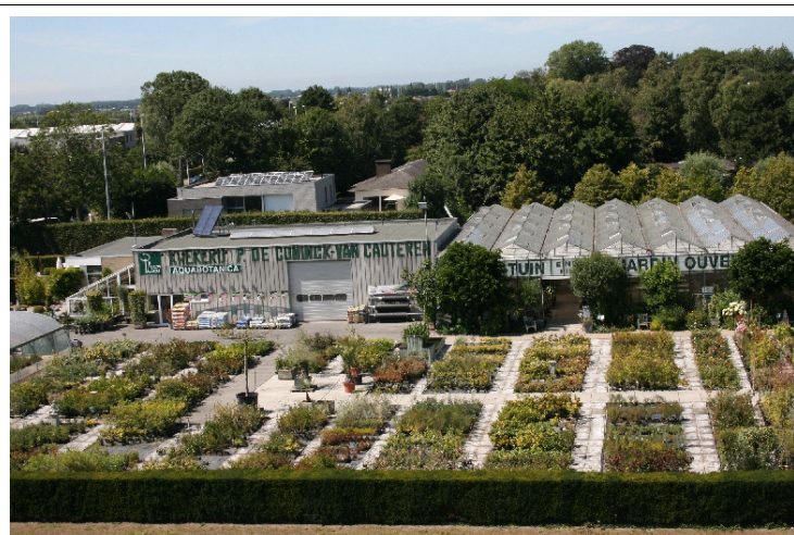
Ieperse Steenweg 112 Veurne – www.aquabotanica.eu